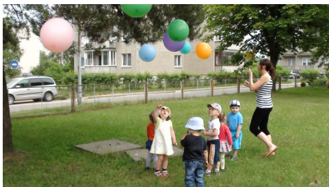
1 pav. Vaikai ieško spalvų gamtoje.

Ant medžio pakabinami spalvoti balionai. Vaikai pasirenka tam tikros spalvos balioną ir ieško tokios pačios spalvos gamtoje: medį, gėlę, dangų, saulę.