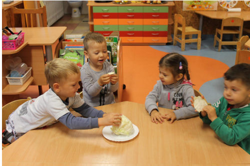
4 pav. Vaikai ragauja kopūstą.

Vaikams duodama ragauti vaisius ir daržoves užmerktomis akimis, o vėliau prašoma įvardinti vaisiaus ar daržovės pavadinimą bei nusakyti skonį: saldu, rūgštu.